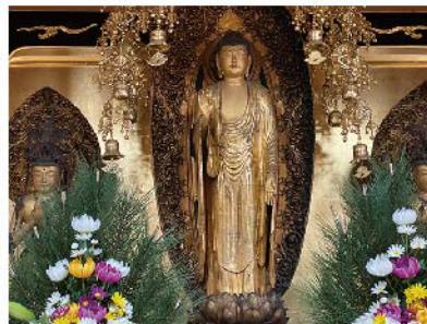
室町期 性高院本尊 阿弥陀如来三尊木立像