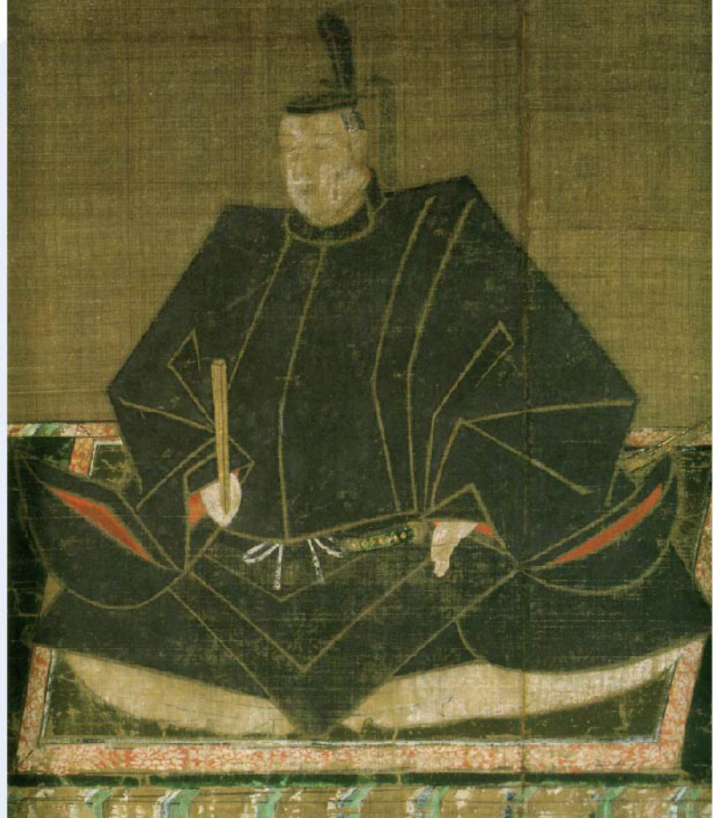
名古屋市指定文化財・松平忠吉像(性高院蔵)