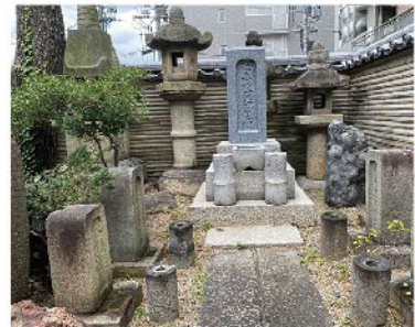
性高院墓所(手前の四つの墓は殉職者の墓)