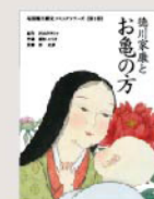
尾張徳川歴史コミック《第一巻》 「徳川家康とお龜の方」