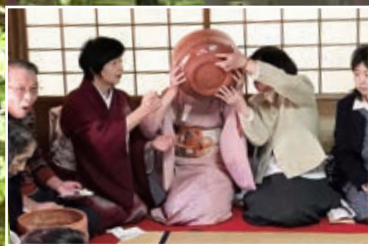
大福茶碗の茶事（第一回春姫茶会）