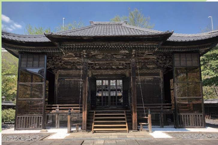
社殿(春姫の御霊屋)