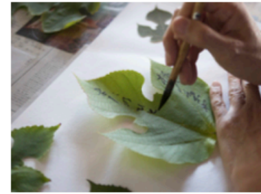
梶の葉に願い事を書きましょう。