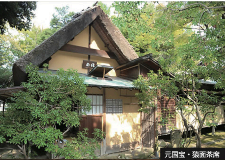
元国宝・猿面茶席